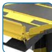
Trava-rodas com acionamento mecânico.

* A FOCA se reserva o direito de fazer modificações em seus produtos sem aviso prévio.