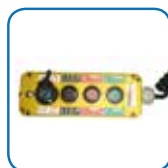
Controle com LED, simples e resistente.