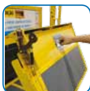
Abertura plataforma manual.