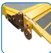
Trava rodas com acionamento mecânico.