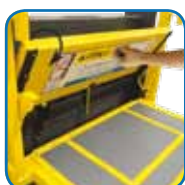
Basculamento degrau manual.