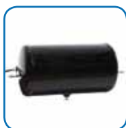
Reservatório auxiliar de ar.