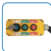
Control simples y robusto.